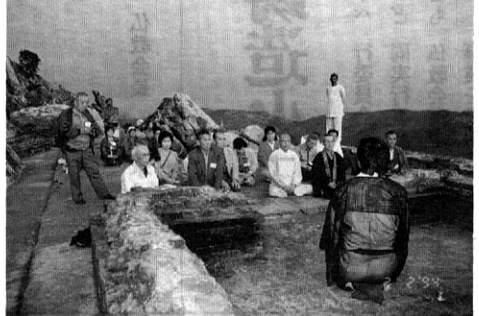
霊鷲山 山頂にある釈尊説法の遺跡にて夕陽を拝み法話を聞く

お申込み要領 期間：平成7年1月24日(火)～2月4日(土)【12日間】 費用：368,000円(名古屋発着・全食付・添乗員同行) 募集人員：20名(最少催行人員15名) 申込金：50,000円(旅費に充当いたします) 申込方法：別紙申込書へ必要事項ご記入の上申込金を添えて下記宛お送り下さい。 申込締切り：平成6年11月18日(金)